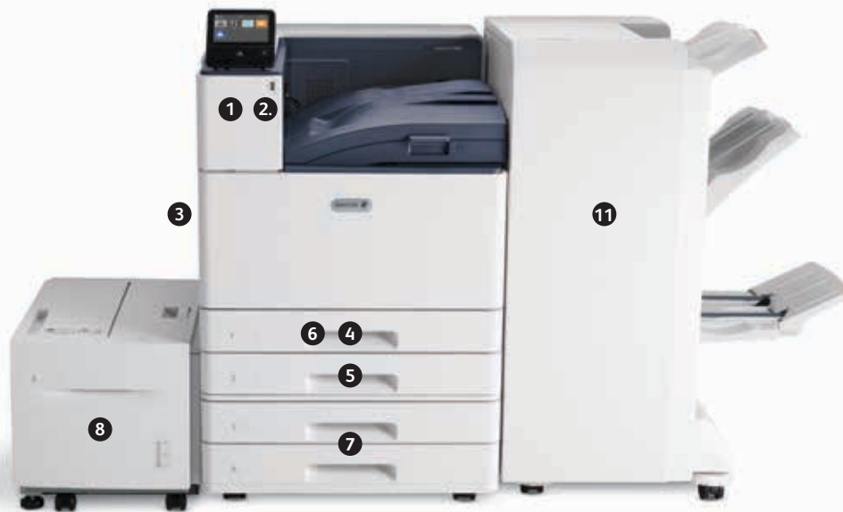
Stampante a colori Xerox® VersaLink® C9000 Stampa. Connettività mobile.

1 Alloggiamento per lettore schede e slot per lettore schede interno.