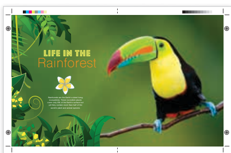
Stampe oversize per il formato A3 al vivo

Con la stampante a colori Xerox® VersaLink® C9000 potete creare applicazioni con finitura completa su un'ampia gamma di supporti per trasformare in splendide realtà le idee dei designer.