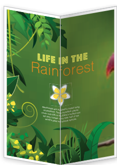
Piegatura a V