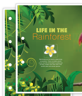
Perforatura a 2-4 fori